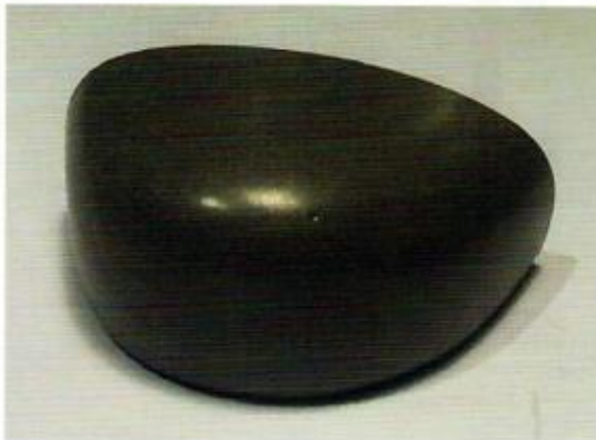
Tip Veiligheidsschoen.

volautomatisch via een recycling wagon gevuld worden. Dit laatste bepaalt welk type bigbags de gebruiker dient in te zetten. Een belangrijke stelregel blijft dat geleidende bigbags te allen tijde van een aardingsklem dienen te worden voorzien om stofexplosie te vermijden. De door Nelco geleverde bigbags zijn steeds voorzien van een binnencoating en dubbele stofnaden zodat ze geschikt zijn voor fijne poeders zoals cycloonpoeders. Het volautomatisch afvullen via de recycling wagon zorgt ervoor dat arbei-